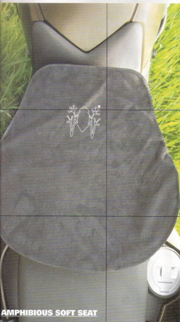
AMPHIBIOUS SOFT SEAT

una moto da turismo particolare: avendo una forte vocazione fuoristradistica, ha una sella più stretta e dura rispetto alle concorrenti prettamente stradali. Ma non è un mistero che molte persone acquistino la F 800 GS per usarla solo su asfalto, godendo della sua maneggevolezza e della posizione panoramica e che, quindi, desiderino una seduta più comoda. L'Amphibious è disponibile, per ora, solo nella versione larga, ma sta per uscirne una versione più piccola. Sulla F 800 sborda un po' ai lati, quando schiacciato dalle cosce, ma non dà fastidio. Utilizza un sistema di autogonfiaggio molto efficace: basta svitare la valvola e, in pochi secondi, acquisisce uno spessore di 4 cm. Usarlo così gonfio, però, è sbagliato. Ci si trova come su una sfera: accelerando, il peso del corpo schiaccia la parte posteriore e gonfia l'anteriore, così ci si sente scivolare indietro; decelerando accade il contrario. Il cuscino va gonfiato pochissimo, entro il cm di spessore, anche perché altrimenti si tende a piantarsi col didietro in un'unica po-